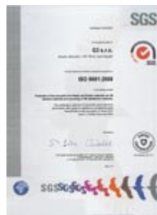
ISO 9001:2008 ENG