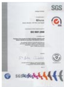
ISO 9001:2008 CZ